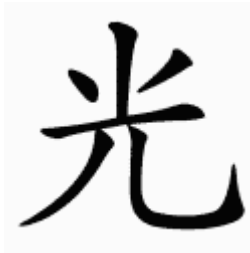
Symbole chinois de la lumière